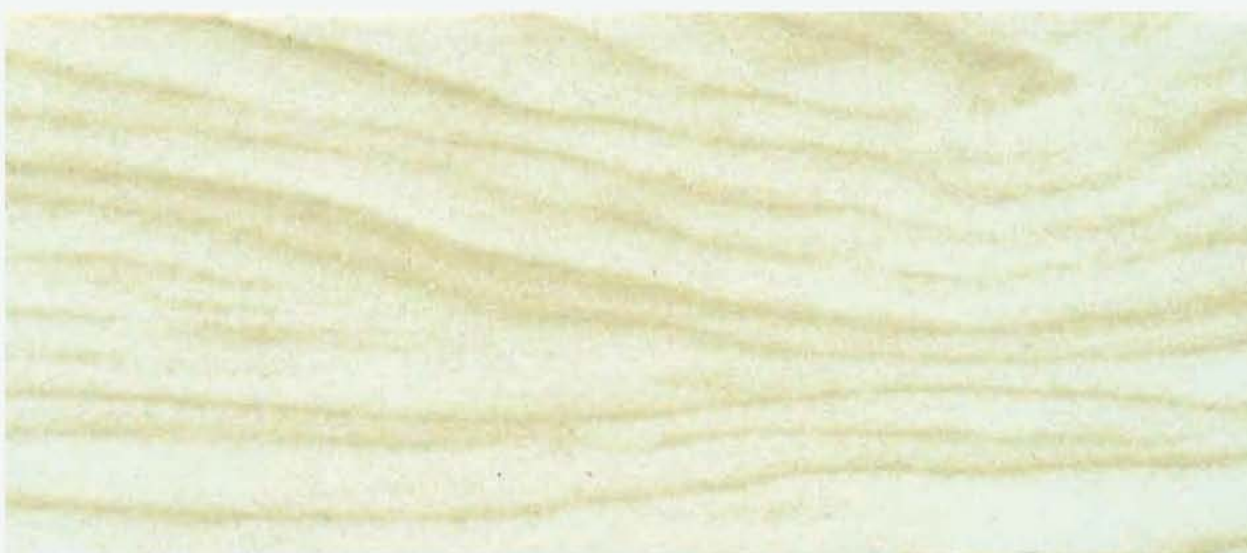
PK R18A LACCATO BIANCO A Fiamma e nodi