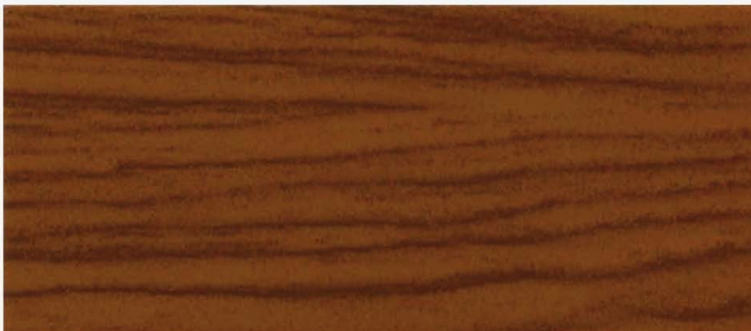
PK R13A CILIEGIO Fiamma