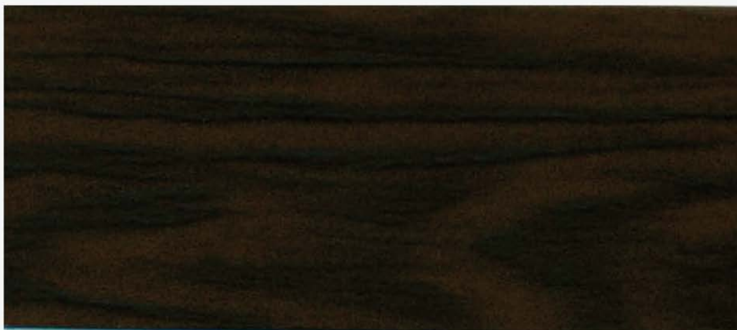
PK R12 NOCE SCURA Fiamma