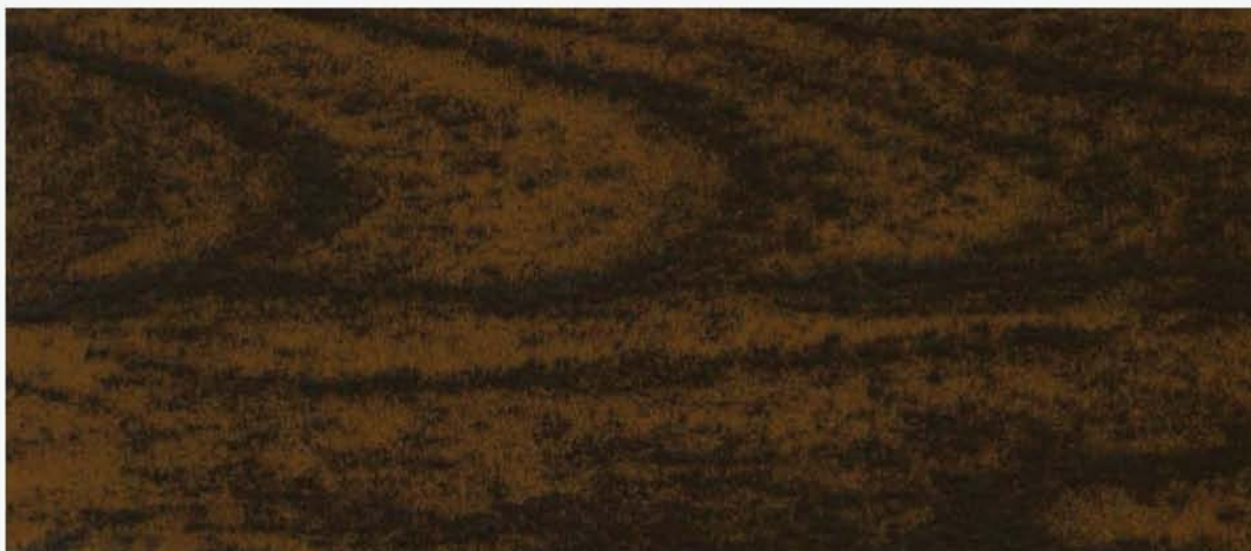
PK R39 SW OLMO