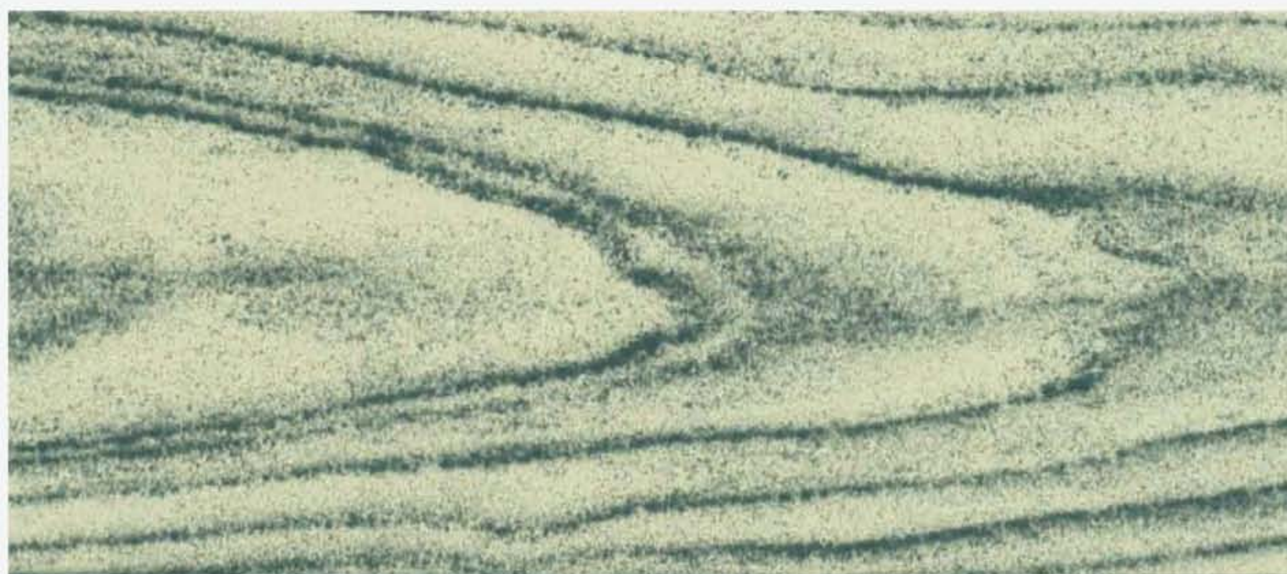
PK R34 CARTA DA ZUCCHERO