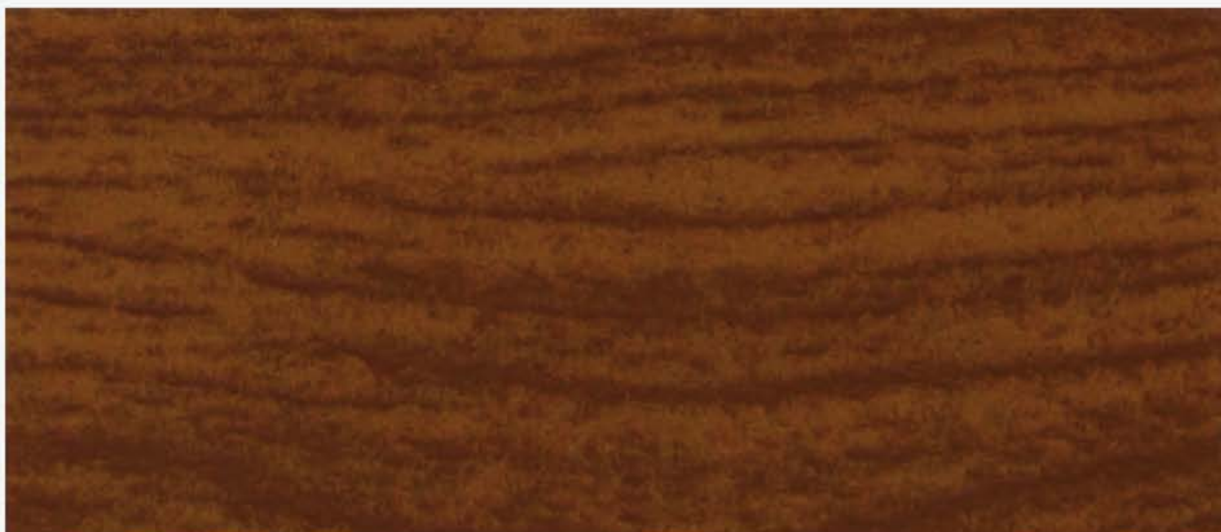
PK R13 CILIEGIO Liscio