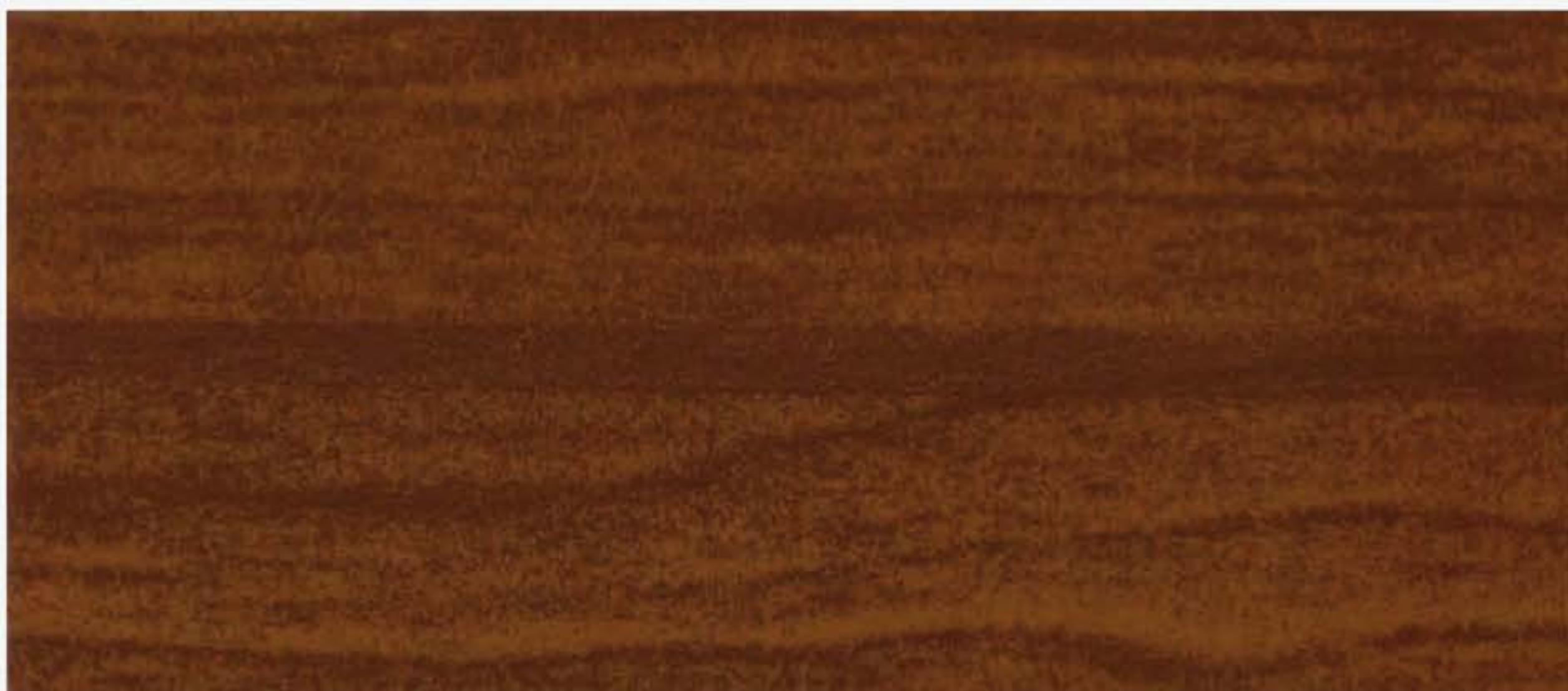
PK R31 SW NUOVO CILIEGIO LISCIO OPACO