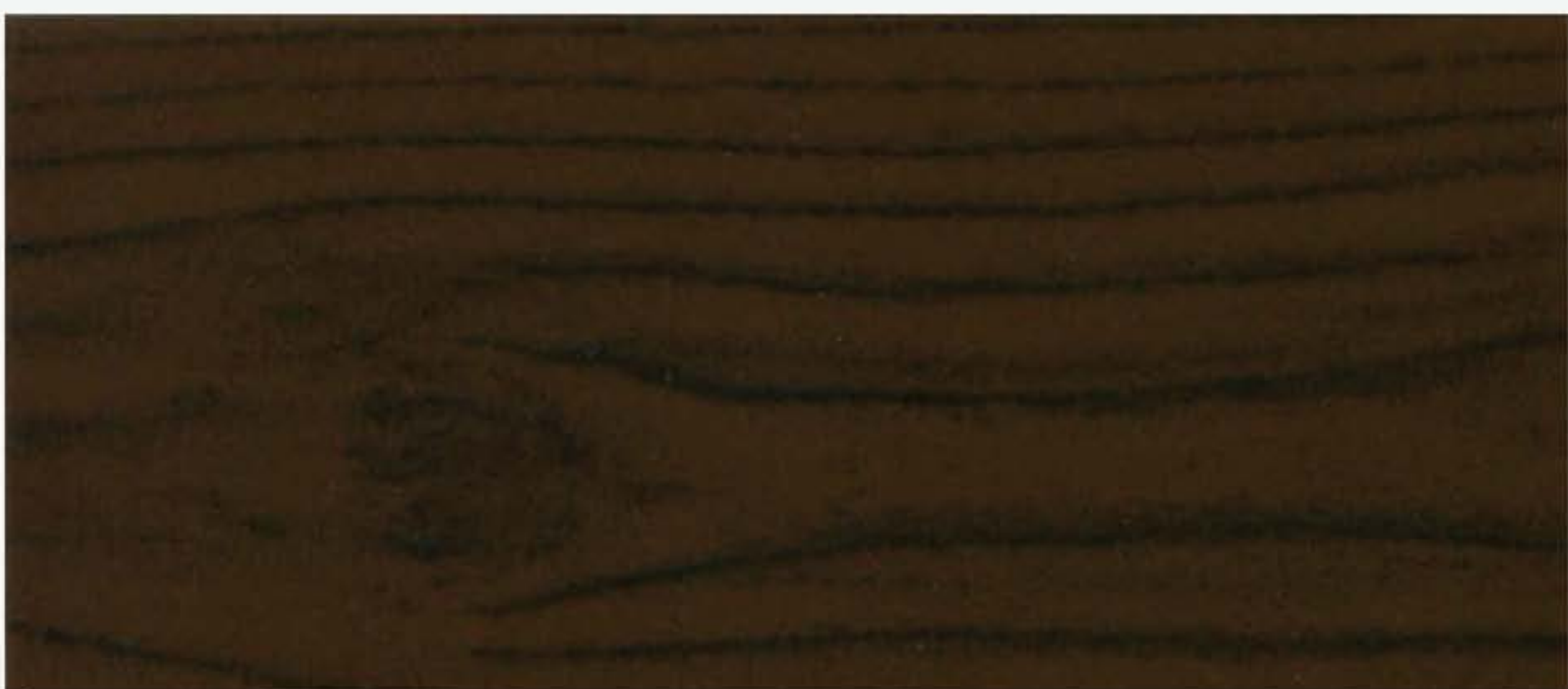
PK R12A NOCE SCURA Nodi