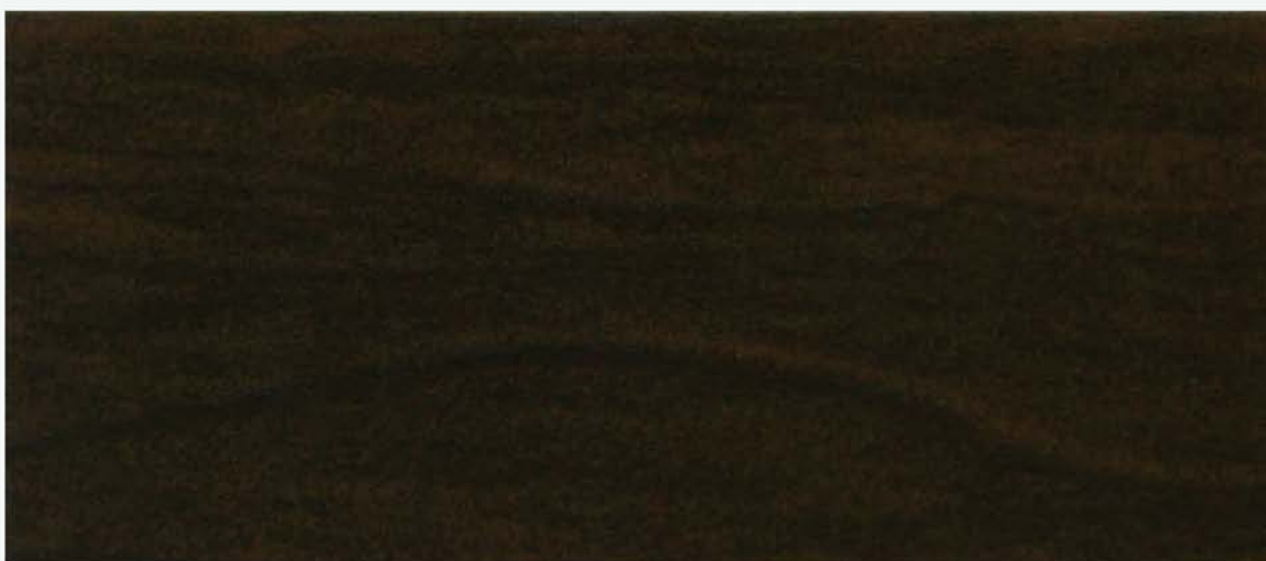
PK R29 SW NOCE VENATA