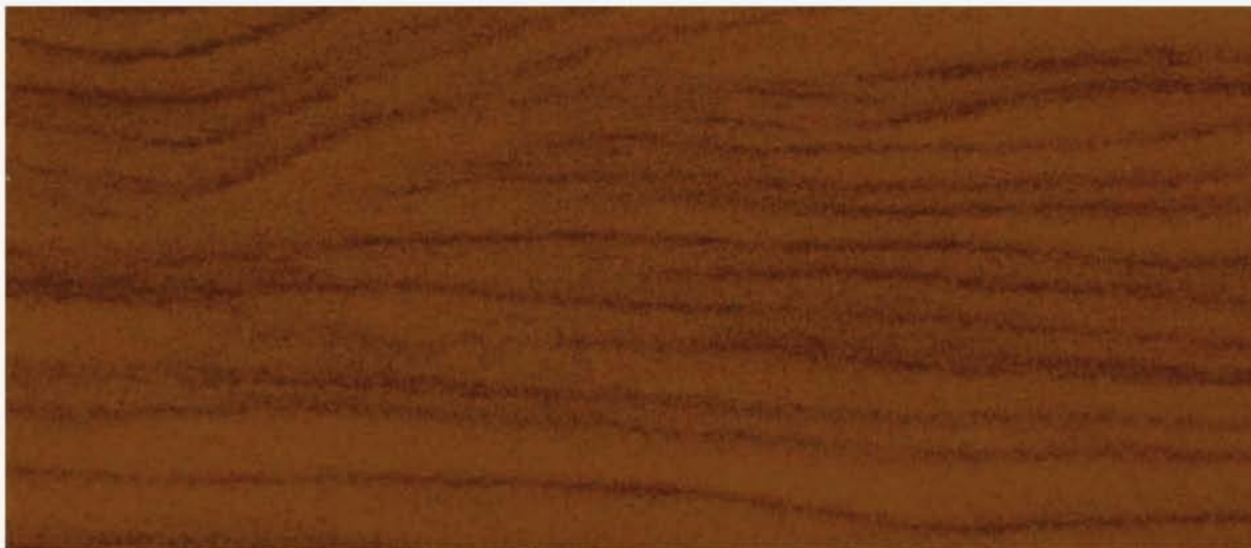
PK R20 CILIEGIO EUROPEO Fiamma e nodi