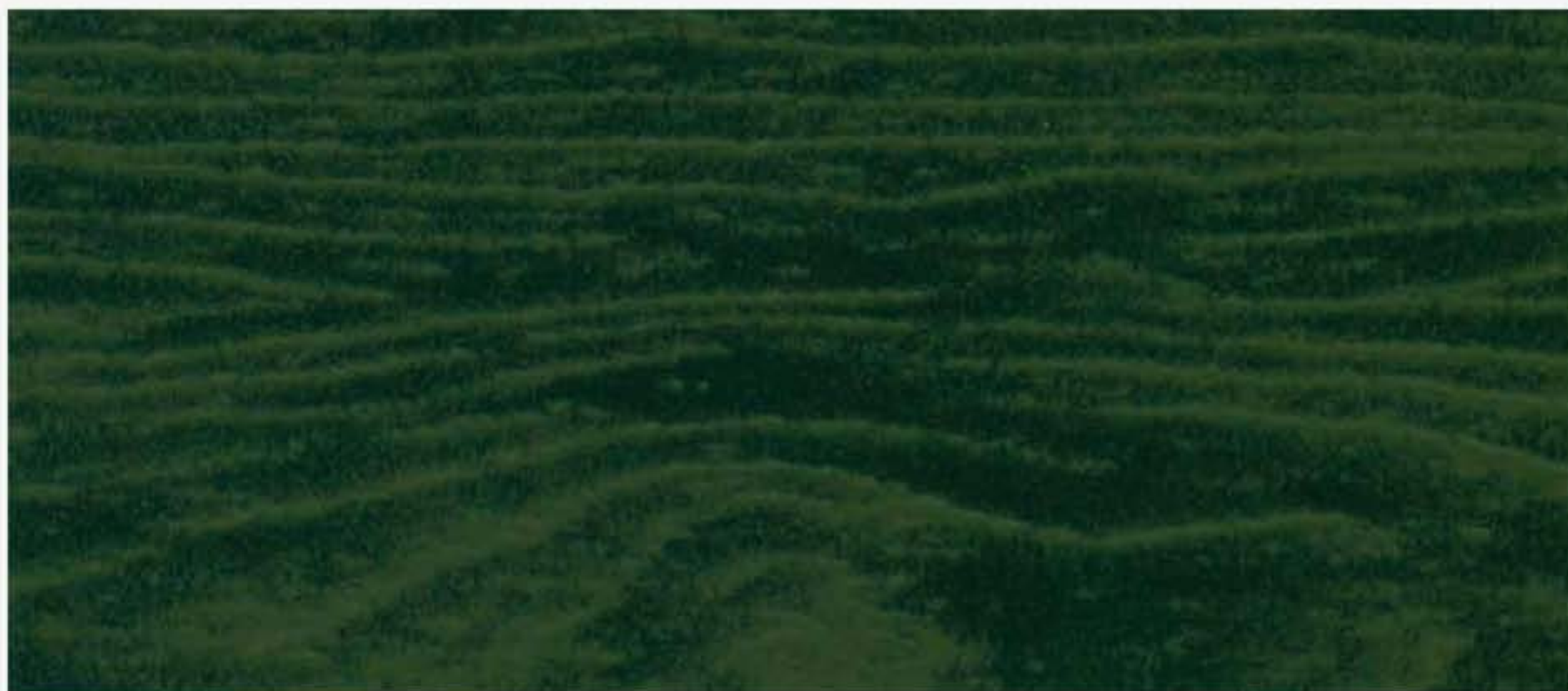
PK R16 LACCATO VERDE