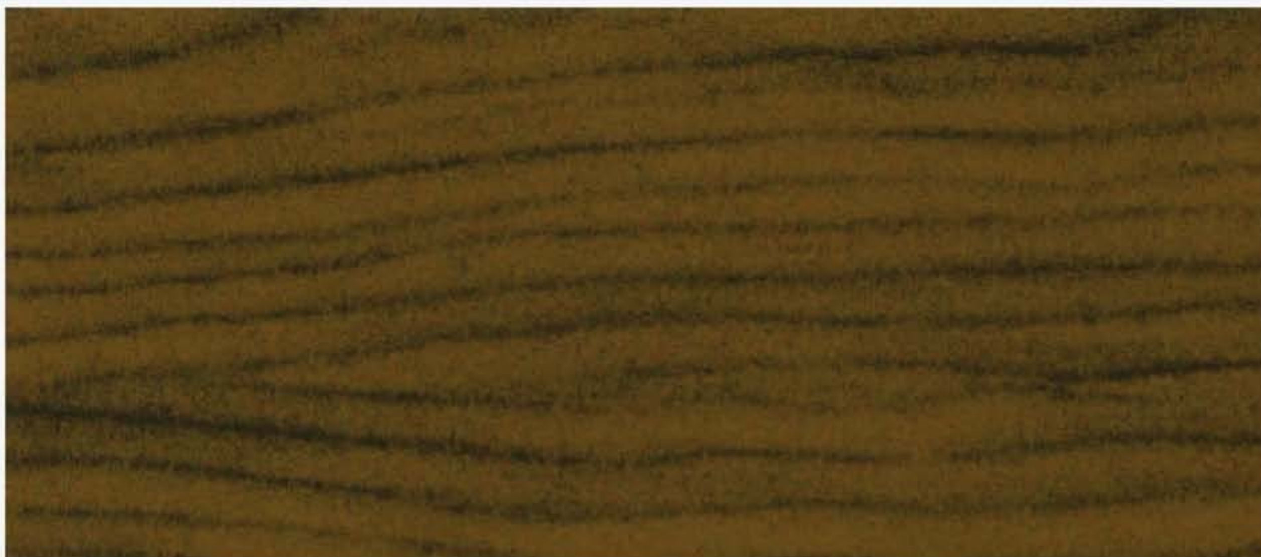
PK R22 NOCE NAZIONALE Fiamma e nodi