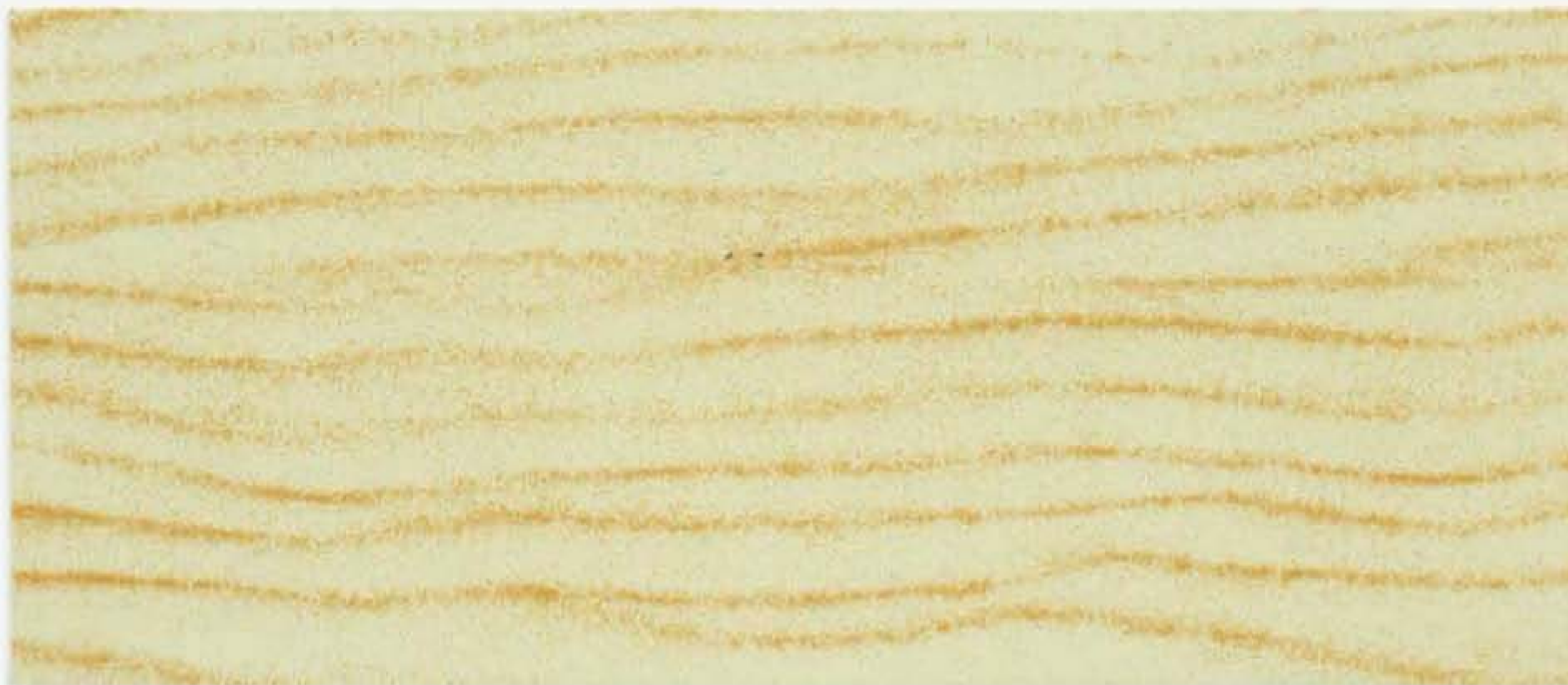
PK R38 ZENZERO