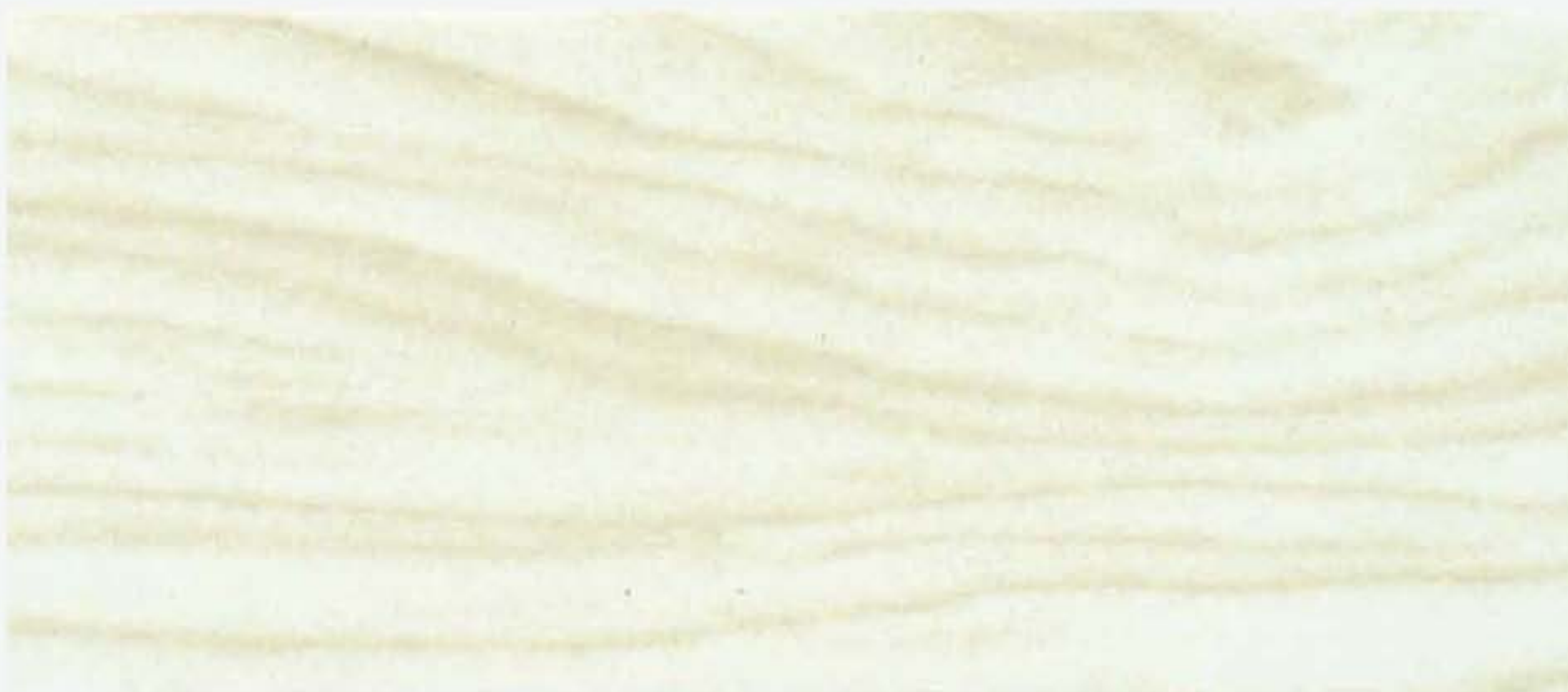
PK R18 LACCATO BIANCO Fiamma e nodi