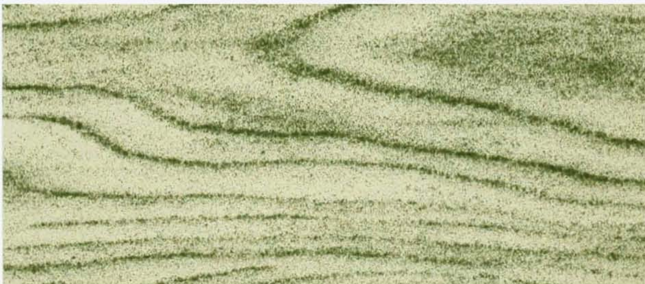
PK R37 SALVIA