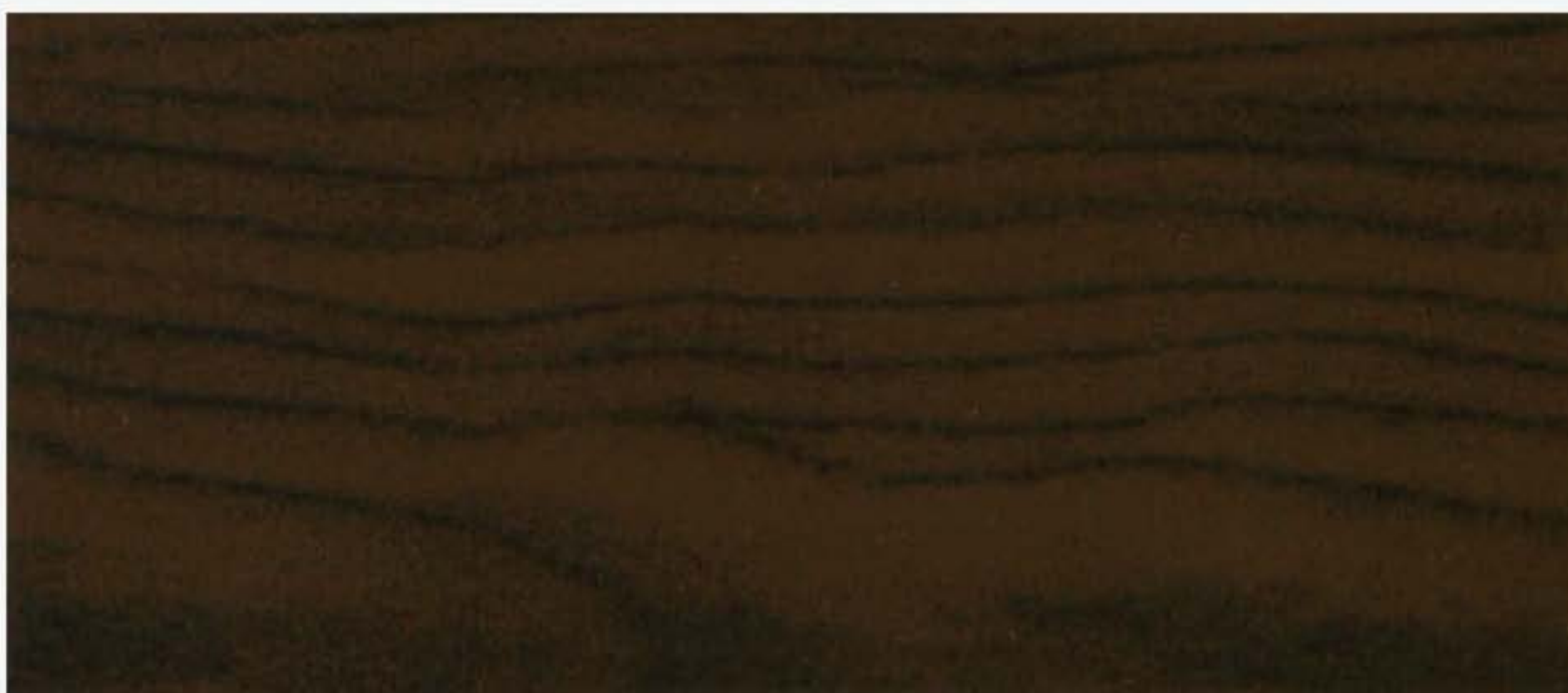
PK R21 NOCE TANGANICA Fiamma e nodi